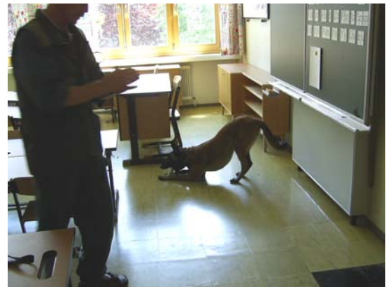
Österreichischer Diensthundeausbilder mit seinem Hund bei einer Suchübung.

Einen großen Dank möchten wir an dieser Stelle den Kollegen der Diensthundeinheit aussprechen, die sich sehr viel Zeit für unsere Fragen genommen haben und uns ermöglichten bei Einsätzen dabei sein zu dürfen, die eigentlich nicht auf unserem Plan standen, aber sehr interessant waren.