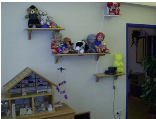
Spielsachen im Vernehmungszimmer.