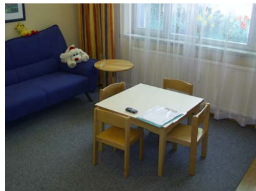
Blickrichtung aus der gleichen Position nach rechts.