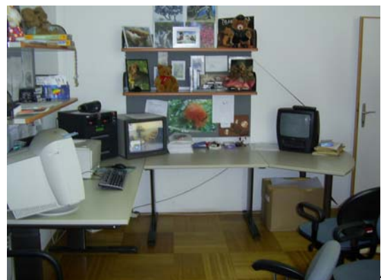
Technikraum und gleichzeitiges Schreibzimmer.