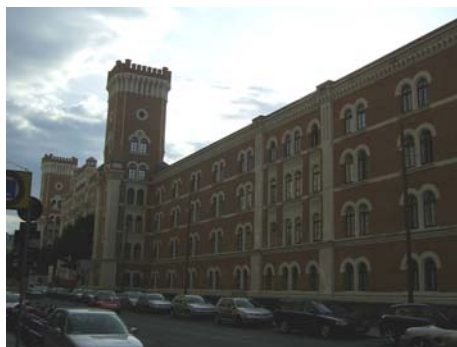
Kaserne der WEGA

Darunter fallen einmal die Einsatzeinheiten von Wien, die mit den deutschen Einsatzeinheiten vergleichbar sind.